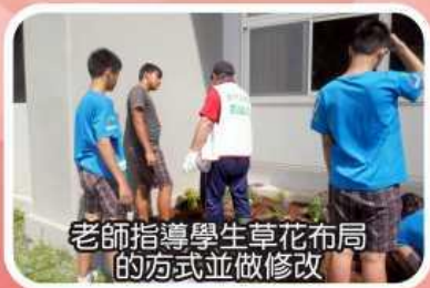
老師指導學生草花布局的方式並做修改