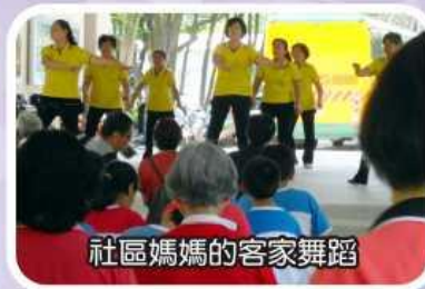
社區媽媽的客家舞蹈