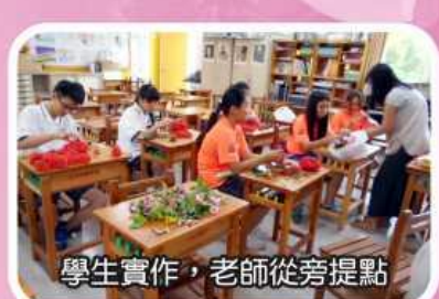
學生實作，老師從旁提點