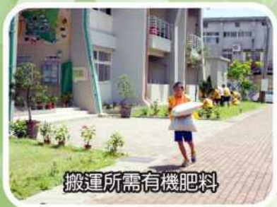
搬運所需有機肥料