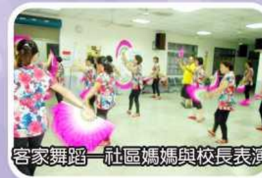
客家舞蹈—社區媽媽與校長表演