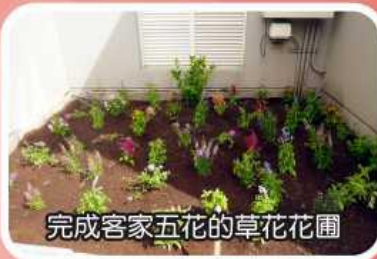
完成客家五花的草花花圃