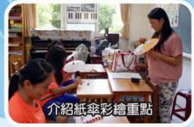
介紹紙傘彩繪重點