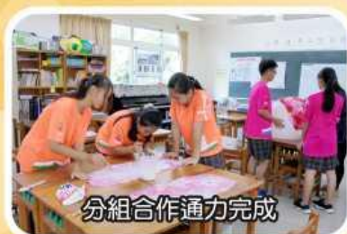
分組合作通力完成