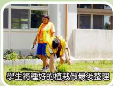
學生將種好的植栽做最後整理