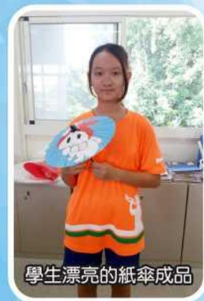
學生漂亮的紙傘成品