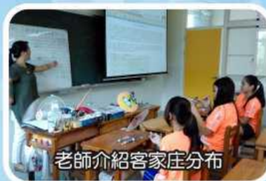
老師介紹客家庄分布