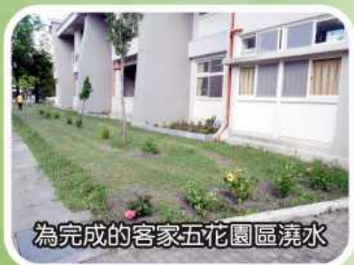
為完成的客家五花園區澆水