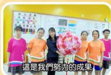
這是我們努力的成果