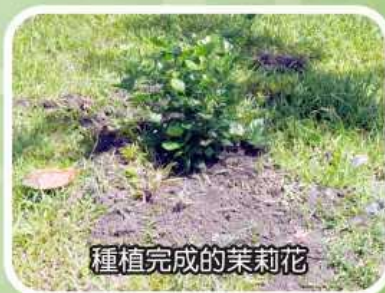
種植完成的茉莉花