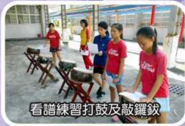
看譜練習打鼓及敲鑼鈸