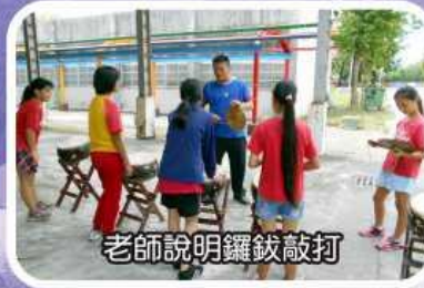
老師說明鑼鈸敲打