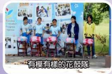
有模有樣的花鼓隊