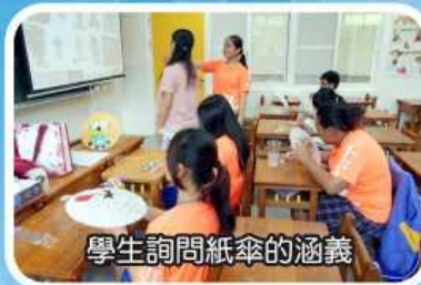
學生詢問紙傘的涵義