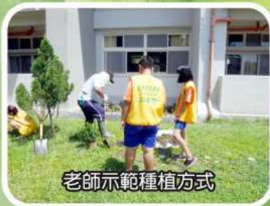
老師示範種植方式