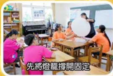
先將燈籠撐開固定