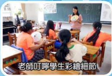
老師叮嚀學生彩繪細節