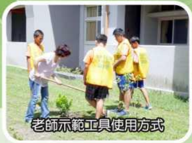
老師示範工具使用方式