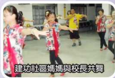
建功社區媽媽與校長共舞