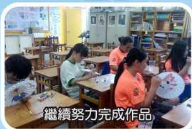
繼續努力完成作品