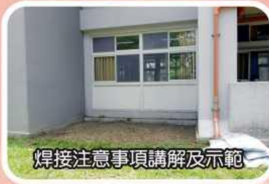
焊接注意事項講解及示範