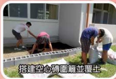
搭建空心磚圍籬並覆土