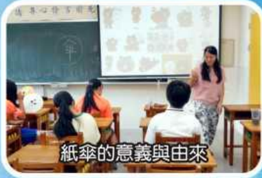
紙傘的意義與由來