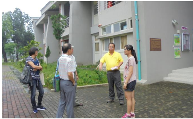
活動內容:校園環境實地訪視