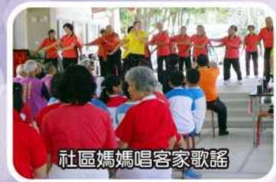
社區媽媽唱客家歌謠