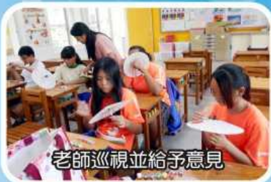
老師巡視並給予意見