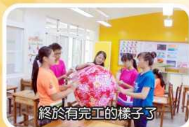
終於有完工的樣子了