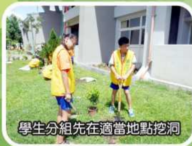
學生分組先在適當地點挖洞