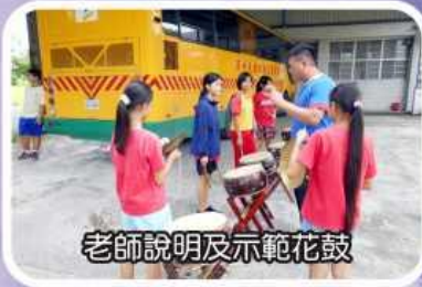
老師說明及示範花鼓