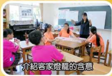
介紹客家燈籠的含意