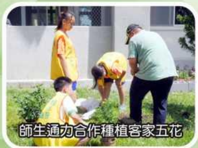
師生通力合作種植客家五花