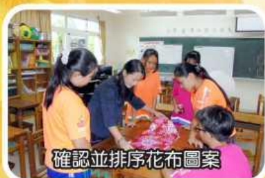
確認並排序花布圖案