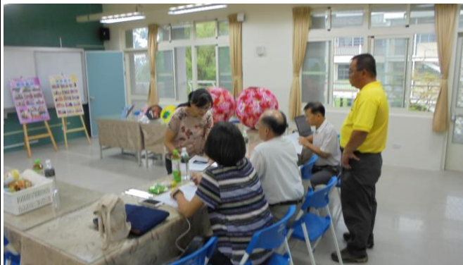
活動內容:訪視內容解說