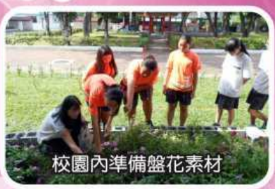
校園內準備盤花素材