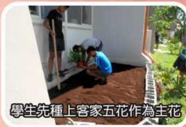
學生先種上客家五花作為主花