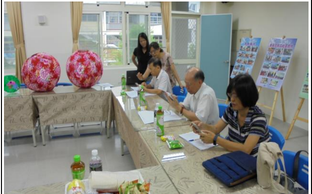
活動內容: 評審審查相關資料