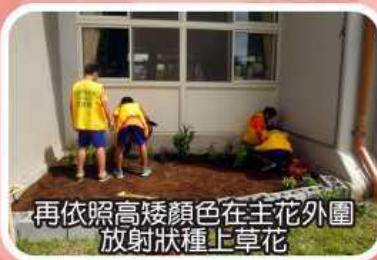
再依照高矮顏色在主花外圍放射狀種上草花