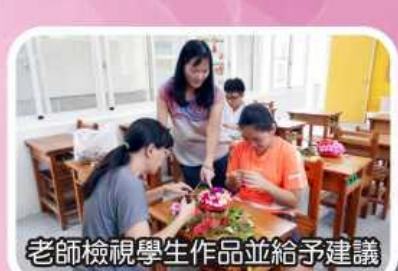
老師檢視學生作品並給予建議