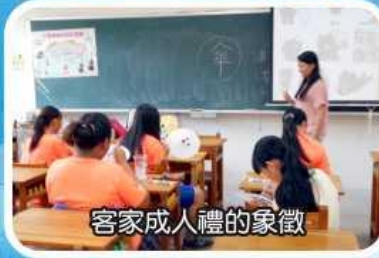
客家成人禮的象徵