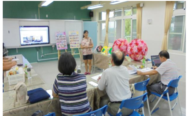
活動內容: 訪視內容解說