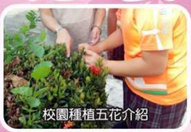
校園種植五花介紹