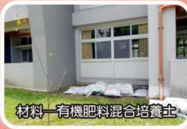
材料—有機肥料混合培養土